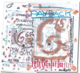
Wertbeutel (von der Aktion 2007)